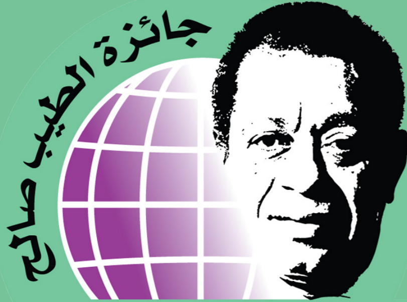
Al Tayeb Salih Award